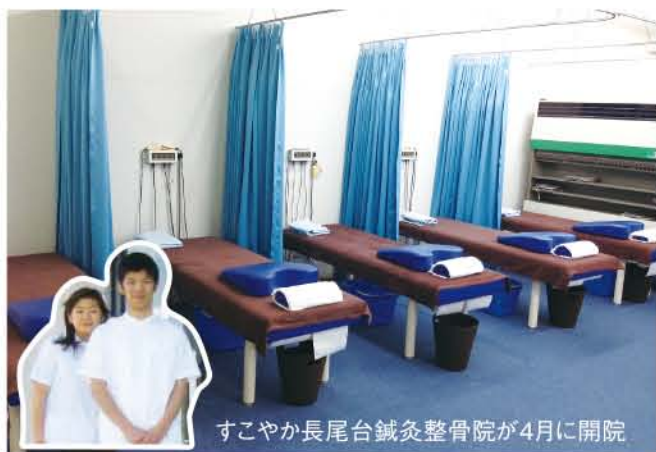
すこやか長尾台鍼灸整骨院が4月に開院

株式会社グリーンベル 企業理念 私たちは利益を還元し、 社会貢献できる 事業を創造します。