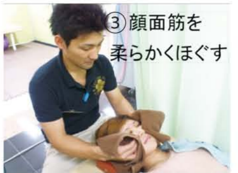
③顔面筋を 柔らかくほぐす

③美顔鍼 前述した通り、ツボというよりも顔面筋をねらい張りか立つ程度の深度で置鍼。（筋層に届く程度）10分。