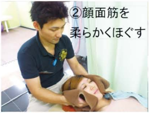
②顔面筋を 柔らかくほぐす

②顔面筋をほぐす 左右平等にオトガイ部、頬部、側頭部、額部、眼輪筋部を7分程度行う。