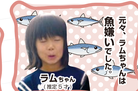
元々、ラムちゃんは魚嫌いでした。 ラムちゃん (推定5才)