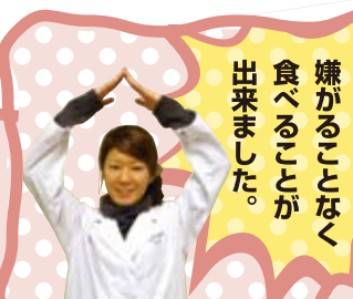
嫌がることなく食えることが出来ました。