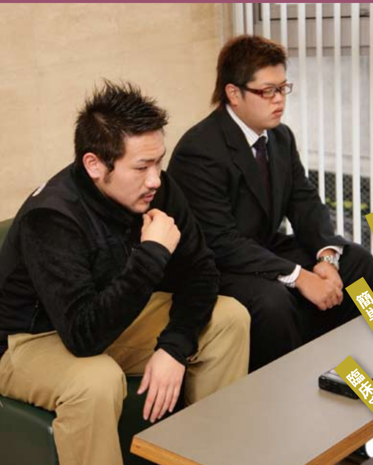
国家試験が勝つと 働き好む人が増え、 院長課題が急増