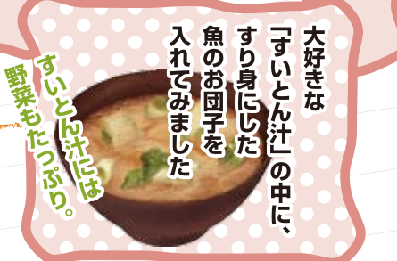
大好きな「すいとん汁」の中に、すり身にした魚のお団子を入れてみました。野菜もたっぷり。すると!!