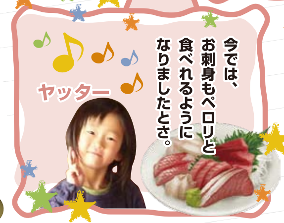
今では、お刺身もペロリと食べられるようになりましたとぞ。