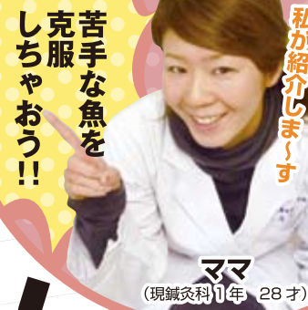
私が紹介しま〜す ママ (現鍼灸科) 11年 28才

健康を考えると気になるのが「食」。このコーナーでは毎回異なる食材をピックアップしていきます。今回のテーマは「魚」。栄養素からお勧めの料理法までたっぷり紹介します!!